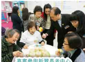
嘉賓參與新翠長者中心老友記的活動。