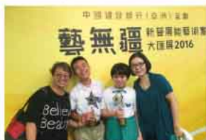
得獎學生與家長領獎合照