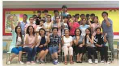
愛人天使2+1探訪區內獨居長者活動